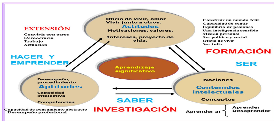
Figura 2. Modelo de aprendizaje de la UJED.

La Universidad Juárez del Estado de Durango, propone un modelo de desarrollo que le permita a la Institución su crecimiento integral, armonizando los intereses nacionales, del Estado y de la comunidad, con los suyos propios. La U.J.E.D., para el cumplimiento de sus fines institucionales busca la superación de la academia, fijando su interés en la búsqueda de la excelencia y conjugando esfuerzos en pos de este ideal. El Marco Pedagógico se basa en el Modelo de Aprendizaje que a continuación se representa en el siguiente esquema: